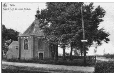
De huidige (uit 1665 daterende) kapel van Werbeek te Retie.