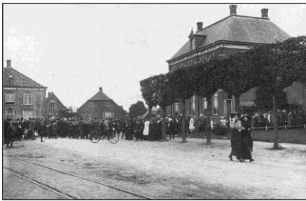
Drukte in de Dorpstraat na terugkeer van de bedevaartgangers naar Werbeek, omstreeks 1918.