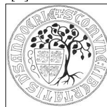
Afbeelding van het vroegste zegel van Oerle uit 1355. (tekening: Jacq. Bijnen)

(Waarschijnlijk werd het domein van de Postelse grondheerlijkheid als niet behorend tot de vrijheid beschouwd.)