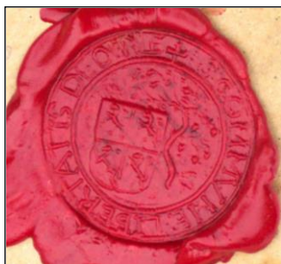
Lakzegel van de vrijheid Oerle (waarschijnlijk 16e eeuw), gebaseerd op de vroegere zegelafbeelding van Zandoerle.

In een latere uitbreiding van bevoegdheden van de Oerlese schepenbank werd het toegestaan leden van buiten Oerle in het schepencollege te benoemen, uiteraard konden alleen de in Oerle wonende schepenen de vrijheid vertegenwoordigen.