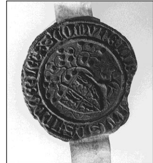
Afbeelding van het zegel uit 1355 met de vroegst bekende vermelding van de naam Zandoerle.

Vervolgens verschijnt de naam Kerkoerle in een schepenakte van 18 september 1374; het gaat hierbij over een hoeve, ghelegen binnen Kercke-Oerle aen die strate , grenzend aan het eigendom van Postel. 7)