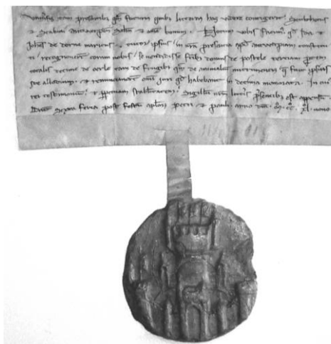
Oudste document waarin de plaatsnaam Oerle (Orle) wordt vermeld. Het stuk is gedateerd 2 juli 1249. (Abdijarchief Postel. Charters Oerle, nr. 1)

De vroegste vermelding van de plaatsnaam Oerle staat in een oorkonde, gedateerd 2 juli 1249. In een vervolgdocument van hetzelfde jaar komt Oerle in verschillende schrijfwijzen voor: de deken van Antwerpen bevestigde dat vrouwe Berta van Orle het halve patronaatsrecht en een derde van de tienden van Orhle had afgestaan aan haar dochter Ida, die dit part op haar beurt weer verkocht aan Floreffe. Achtereenvolgens is er de schrijfwijze Oerle (1249), Orle, Orhle en Ourle 2x (1249), Urle (1250), Orle 2x (1250), Vrle 2x (1251), Urle (1254). 1)