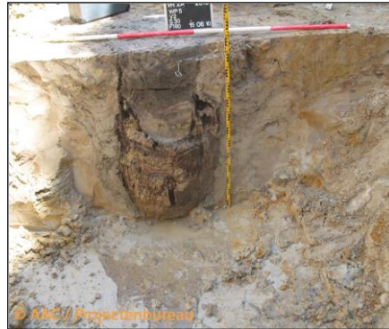
Deze (Merovingische) waterput was een boomstamp, die ten minste twee gebruiksfases bleek te hebben gekend, getuige de resten van twee putschachten. Van de diepste put (1 e fase) bevond de onderkant zich op circa 5 m onder het maaiveld.